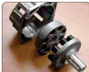
Junta elástica integrada para el mejor acoplamiento de la bomba (excepto modelo 1211)