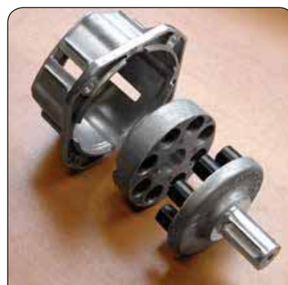
Junta elástica integrada para el mejor acoplamiento de la bomba